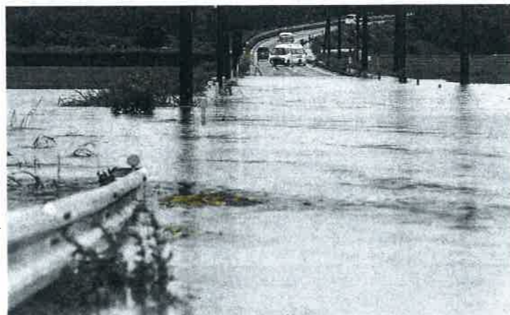
大雨で冠水した鹿児島県志布志市の道路=三日午後3時44分

梅雨前線の活動が一段と活発化した影響で、九州を中心に西日本と東日本では四日夜にかけて大雨になりそうだ。気象庁は三日、土砂災害や低い土地の浸水、河川の氾濫に厳重な警戒を呼び掛けた。鹿児島、宮崎両県で避難指示が出た対象は百十万人を超えた。避難勧告も続出。堤防の決壊のほか、車が土